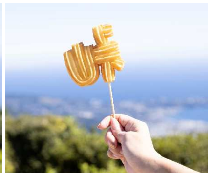
峠チュロス 500 円