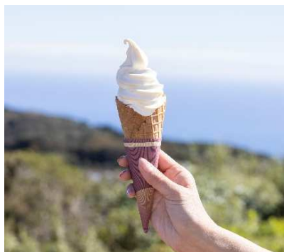
特濃ソフトクリーム ～地元 丹那牛乳使用～ 500 円