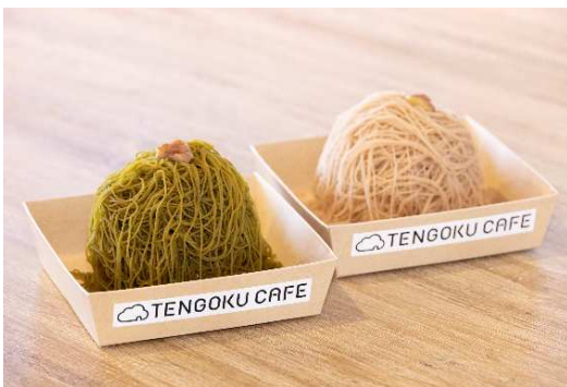
1059 モンブラン(静岡茶/マロン) 各 1,000 円